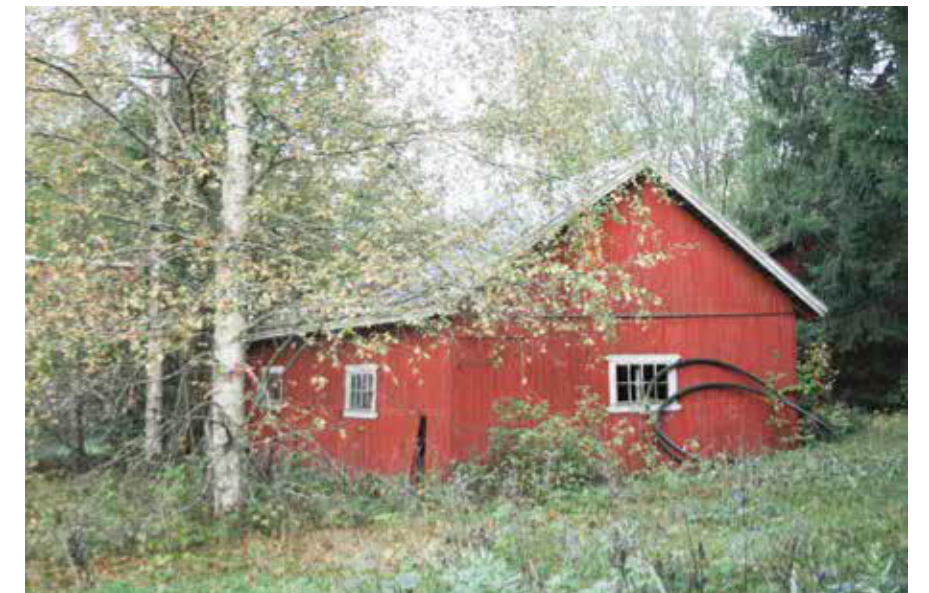
103B Perttilän pihavaja pihan puolelta.