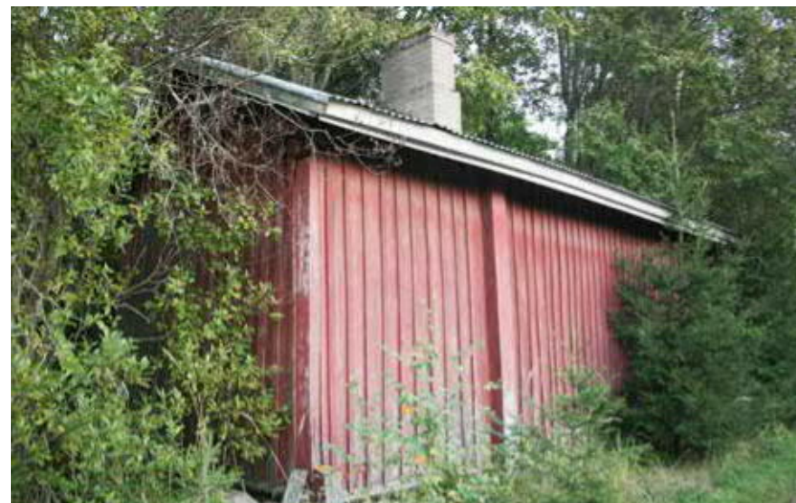
103A Perttilän pihasauna.