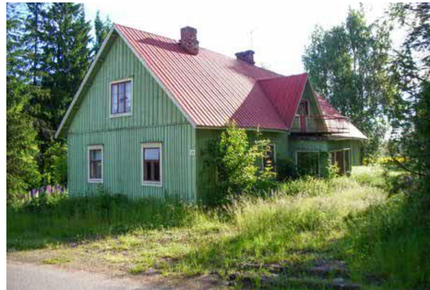
103 Perttilän päärakennus 2005. PS.

Osayleiskaavassa pihapiirin keskeisin alue on merkitty sr(8)-merkin-nällä ja pihapiirin Nahkelanraitin varrella olevia rakennuksia sivuaa sr-t-merkintä. 2 LUOKAN KOHDE.