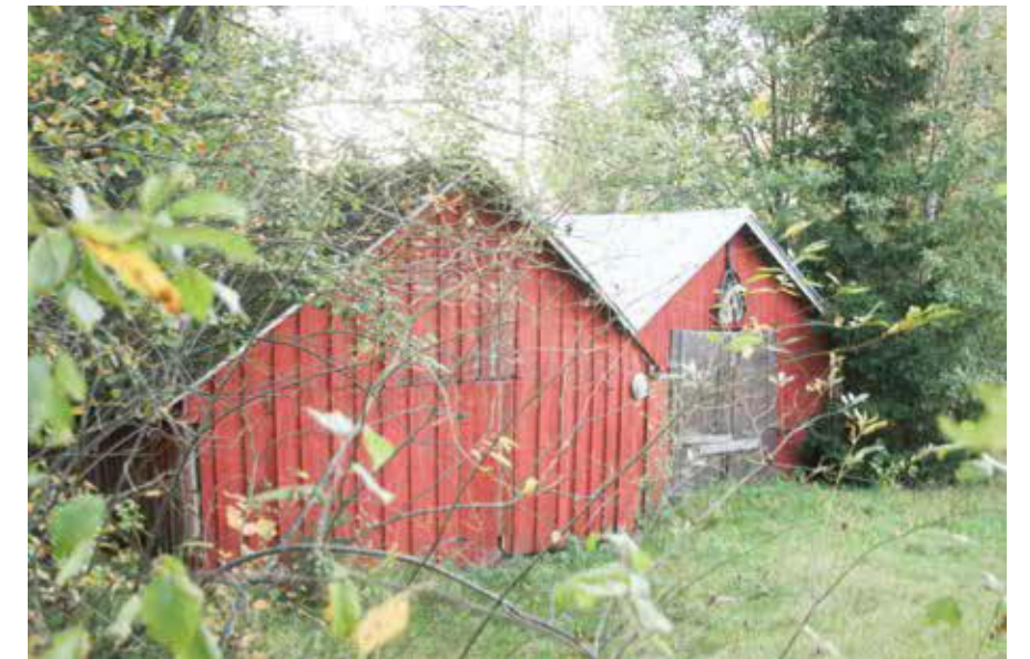
103B Perttilän pihavajat.