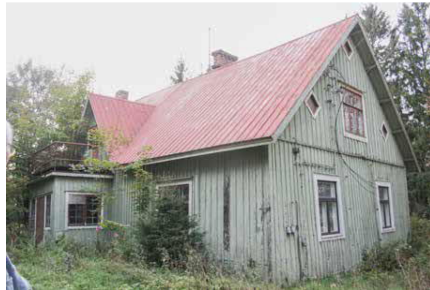
103 Perttilän päärakennus 2014.